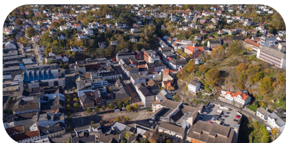
Estetisk byplan Design, farger, lysdesign og opplevelser