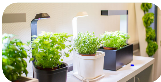
Områder der innbyggerne kan dyrke i byen