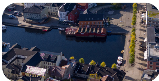
Badeplass i Pollen